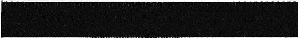
Kolor 0099 (czarny)

Metraż/Rodzaj nawoju: 50 m / rolka Skład surowcowy: poliester 100 %