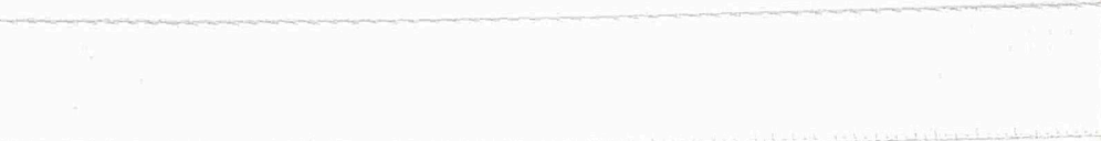
Kolor 0001 (natural)