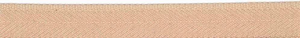
Kolor 1359 (beż)