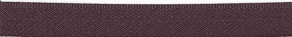
Kolor 1356 (ciemno szary)