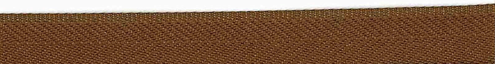
Kolor 1303 (khaki)