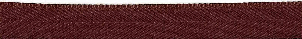
Kolor 1363 (brąz)