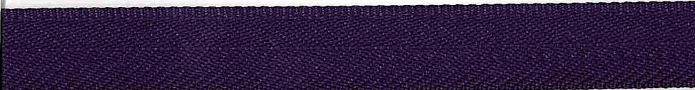
Kolor 1353 (granat)