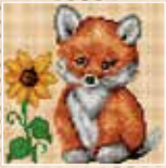
■ ● 1005