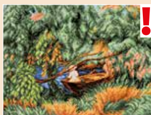
■ ● 0817