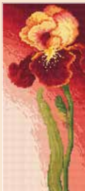
F AN 4690 15×33 cm Wytworny irys B. Sikora-Małyjurek