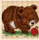
■ ● 1006