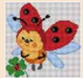
■ ● 1024