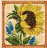
■ ● 1014