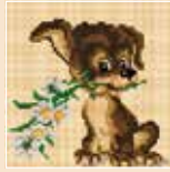
■ ● 1010