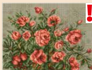
■ ● 0816