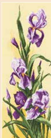
J AN 770 28×74 cm Irysy