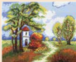
■ ● 0704