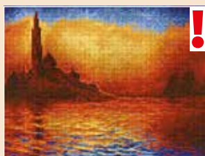
■ ● 0815