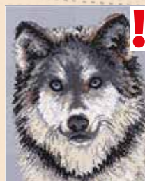
■ ● 0461