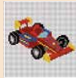
■ ● 1019