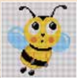
■ ● 1021