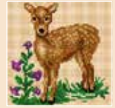
■ ● 1008