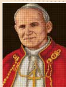
■ ● 8000