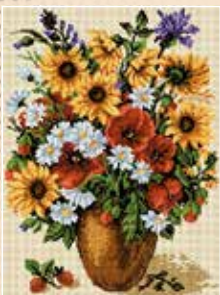
■ ● 8015