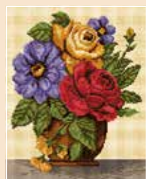
■ ● 6000