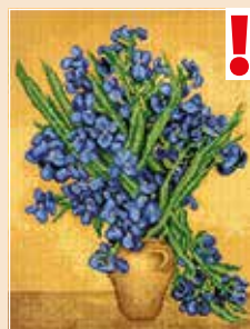
■ ● 0820