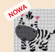
■ ● 1031