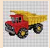
■ ● 1020