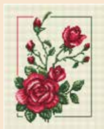
■ ● 0454