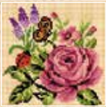
■ ● 1017