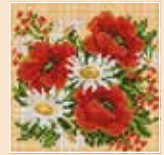
■ ● 1016