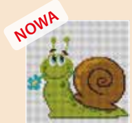
■ ● 1032