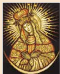
■ ● 0710