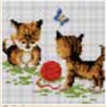
■ ● 1009