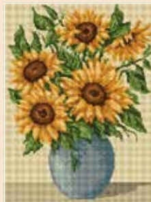
■ ● 8013