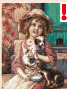
■ ● 0811