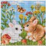
■ ● 1013