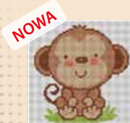
■ ● 1030