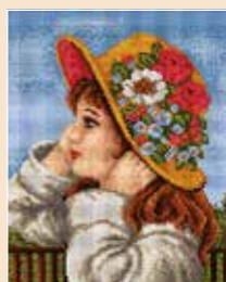
■ ● 6002