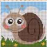
■ ● 1025