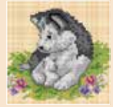
■ ● 1012