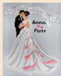
■ ● 0712*