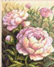
E AN 4480 20×25 cm Pastelowe piwonie B. Sikora-Małyjurek