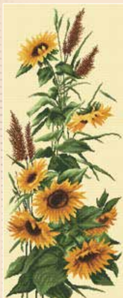
K AN 756 33×81 cm Słoneczniki