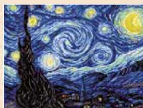
■ ● 0818