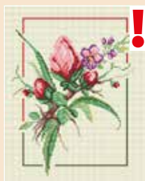
■ ● 0456