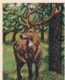
■ ● 0462