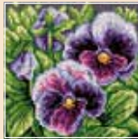
■ ● 1018