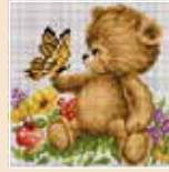
■ ● 1011