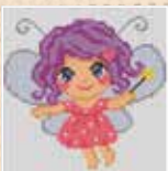
■ ● 1029