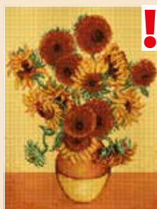
■ ● 0819