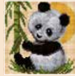
■ ● 1007