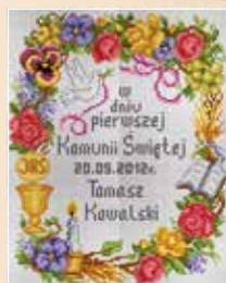
■ ● 0713*