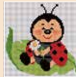
■ ● 1023