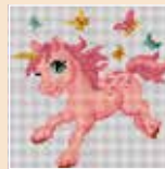
■ ● 1027