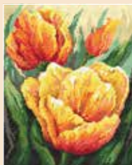
E AN 4481 20×25 cm Pastelowe tulipany B. Sikora-Małyjurek