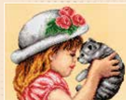
■ ● 6004

* Kanwa/Malwina z miejscem na wyhaftowanie dowolnego tekstu.