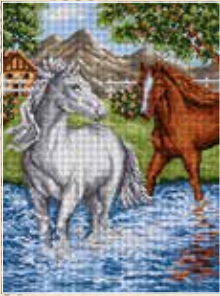
■ ● 8001