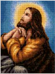
■ ● 8007