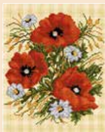
■ ● 6001