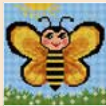
■ ● 1022