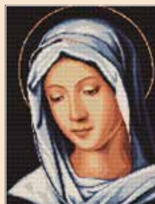
■ ● 0813