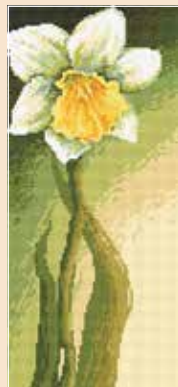
F AN 4691 15×33 cm Dostojny narcyz B. Sikora-Małyjurek