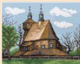
■ ● 0711