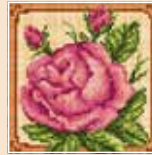
■ ● 1015