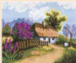
■ ● 0703