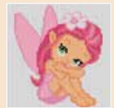
■ ● 1028